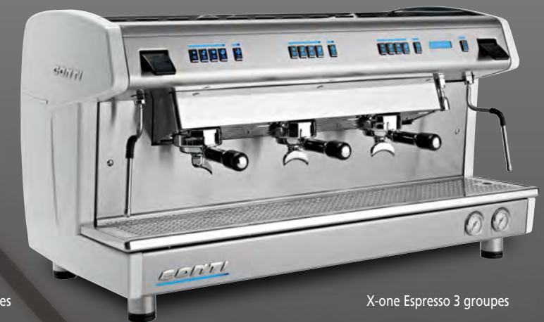
X-one Espresso 3 groupes