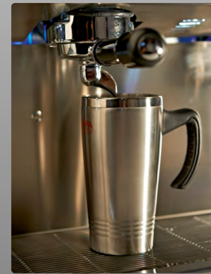
Tall Cup (TC) pour gobelets et « Take Away », hauteur sous bec = 160 mm Tall cup (TC) for high cups and take away Spout height = 160 mm