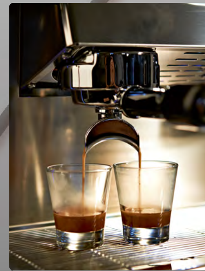
Espresso (E), hauteur sous bec = 83 mm Espresso (E), spout height = 83 mm