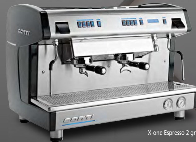
X-one Espresso 2 groupes