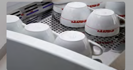
Chauffe tasses de grande capacité avec arrêts tasses High capacity of the cup warmer with stopping edges