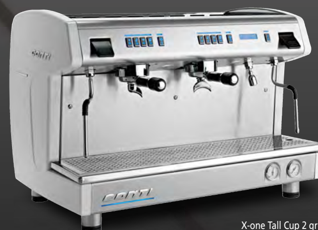
X-one Tall Cup 2 groupes