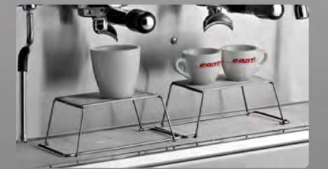
Rehausseurs de tasses pour version Tall Cup Wire stands for Tall Cup version