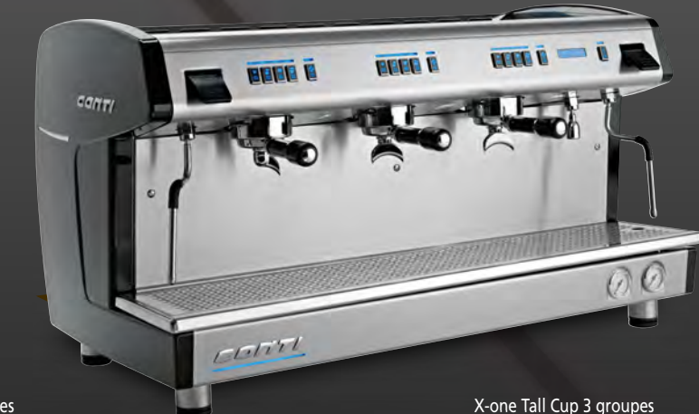
X-one Tall Cup 3 groupes